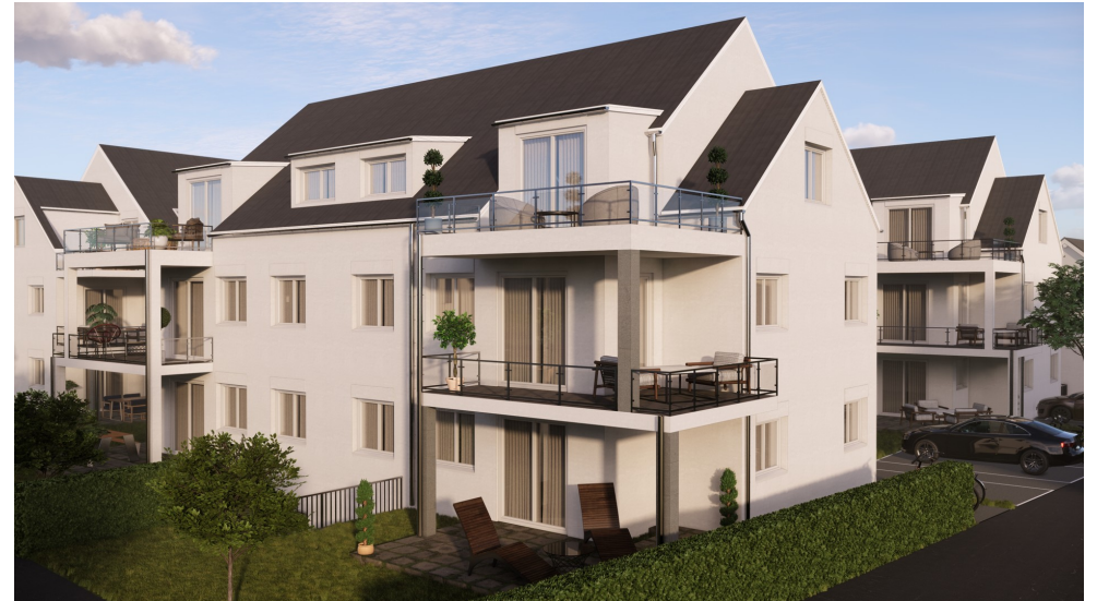
BI-25-04-Grd.-Vis_Haus 4+5 West