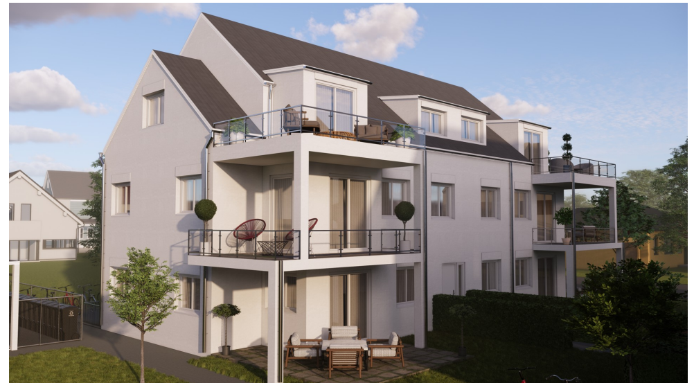
BI-25-04-Grd.-Vis_Haus 4 Süd