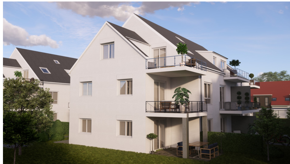
BI-25-04-Grd.-Vis_Haus 3 Süd