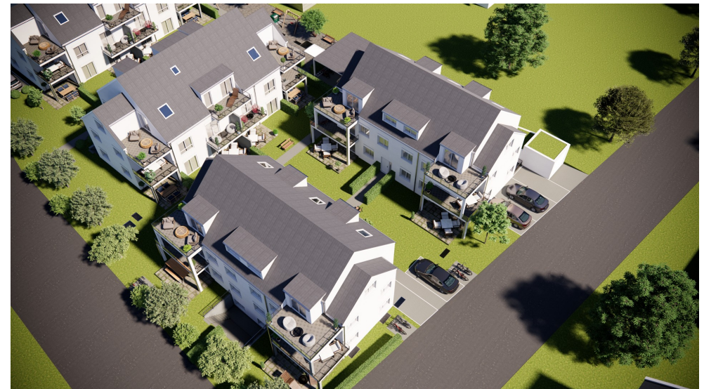
BI-25-04-Grd.-Vis_Haus 3+4+5 TOT