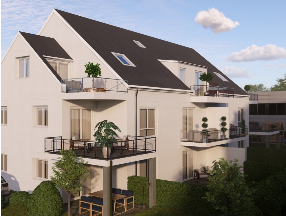
BI-25-05-Vis_Haus 2 Süd1