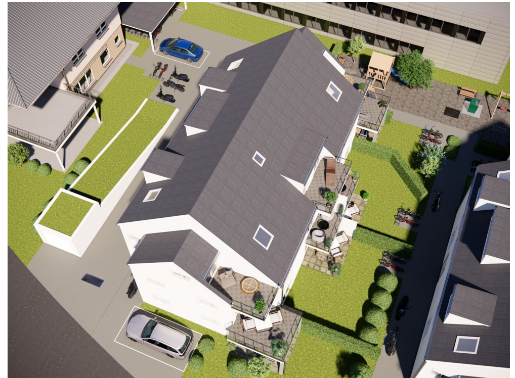
BI-25-05-Vis_Haus 2 birds_eye_view