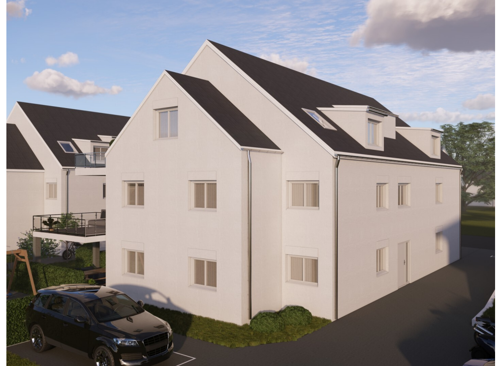
BI-25-05-Vis_Haus 2 Ost