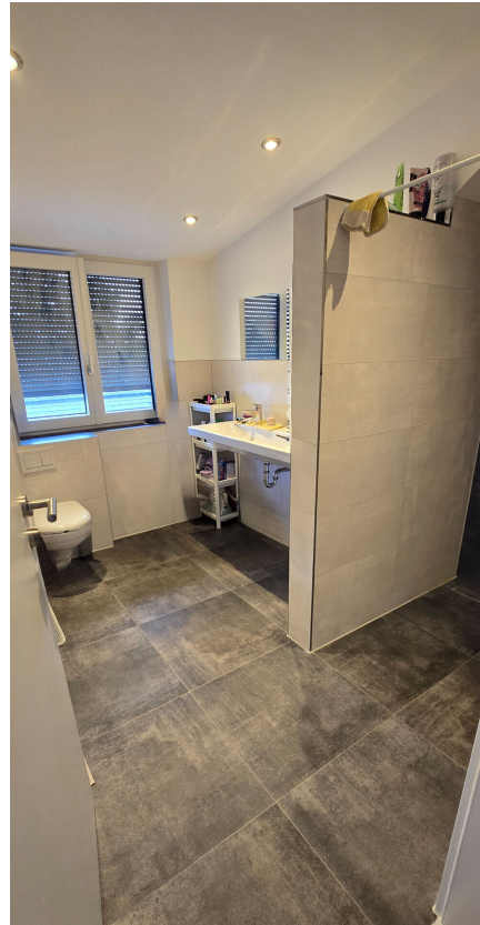
24-06-W6-Badezimmer2-frei begehbare Dusche