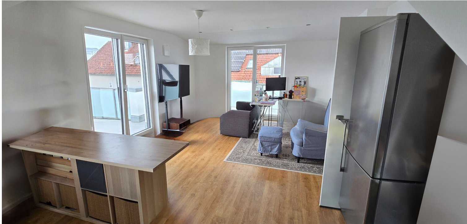
24-06-W6-Wohn-Essbereich Zugang 2 Balkone